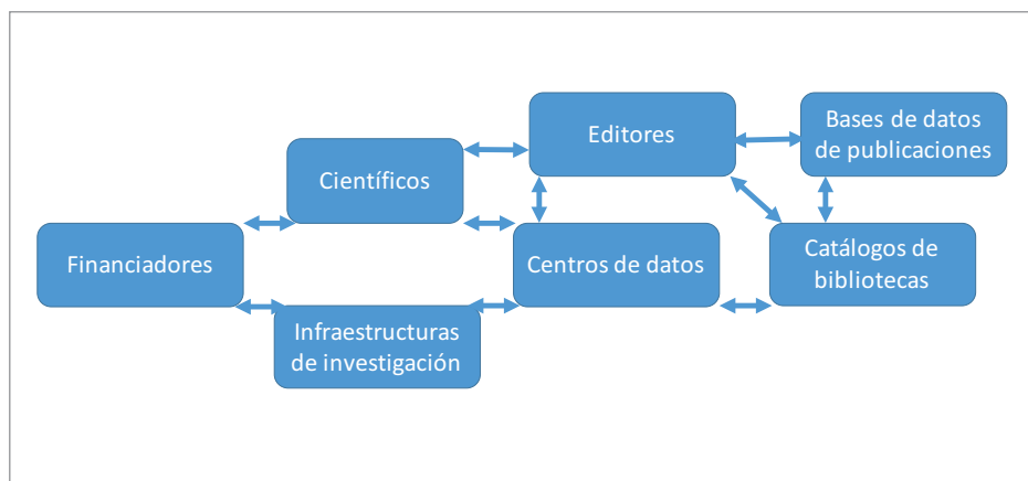
Figura 2. Agentes implicados en la publicación de datos. Fuente: Costas et al., 2013