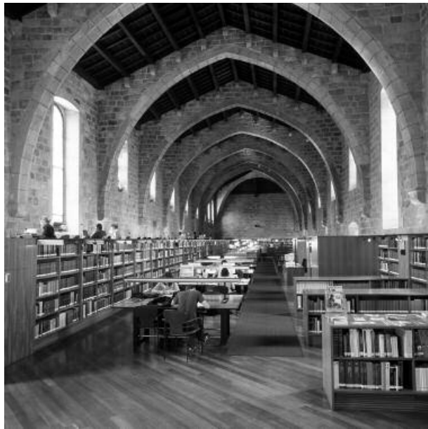
Figura 2. La Biblioteca de Catalunya

En lo que respecta a la captura, se llevó a cabo un ejercicio de definición del tipo de recursos digitales susceptibles de captura, así como del alcance temático del proyecto. Es evidente que la tecnología que se aplica a los sistemas de repositorio digital cambia y cambiará en el futuro de forma importante; por ello las variables sobre la naturale-