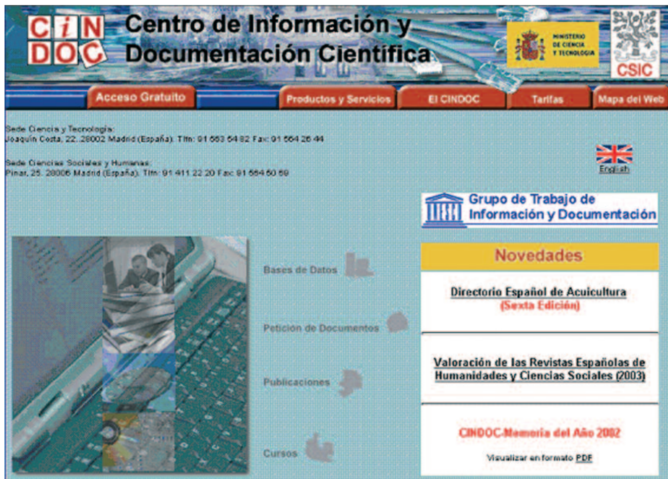
Gráfico 1. Web del Cindoc en octubre de 2003