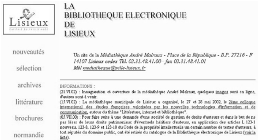
Biblioteca digital de Lisieux

Por otro lado, el usuario está muy habituado al uso de internet