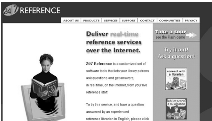
Servicio de referencia en línea en EUA

Por otro lado, para Lahary internet y las bibliotecas no son tan diferentes como pueda parecer: "las dos herramientas ofrecen un acceso local a recursos globales". Si los usuarios de internet están acostumbrados a una consulta sin restricciones, muchas veces totalmente anárquica, en las bibliotecas