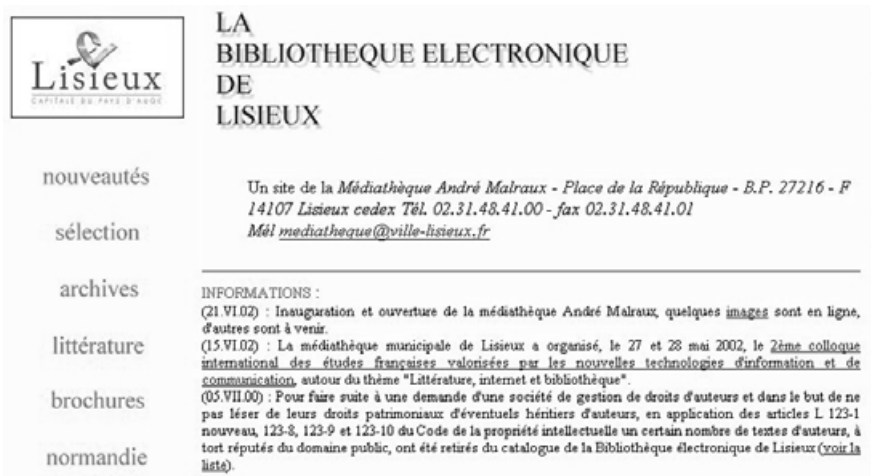
Biblioteca digital de Lisieux

Por otro lado, el usuario está muy habituado al uso de internet