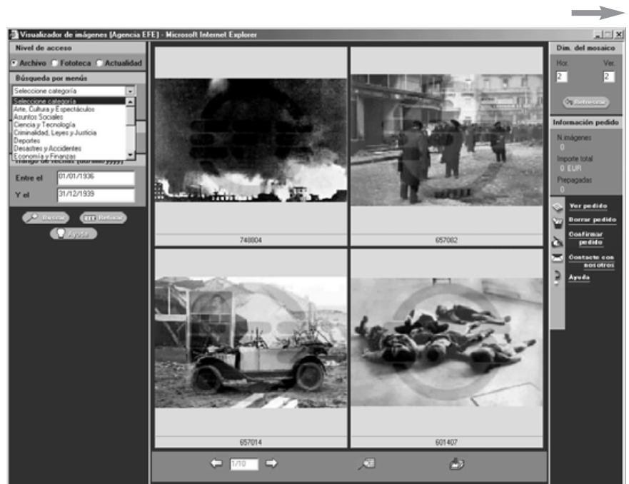
Resultado de una búsqueda de imágenes en la fototeca de la Agencia EFE