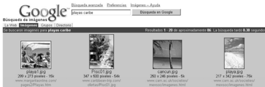
Resultado de una búsqueda de imágenes en Google