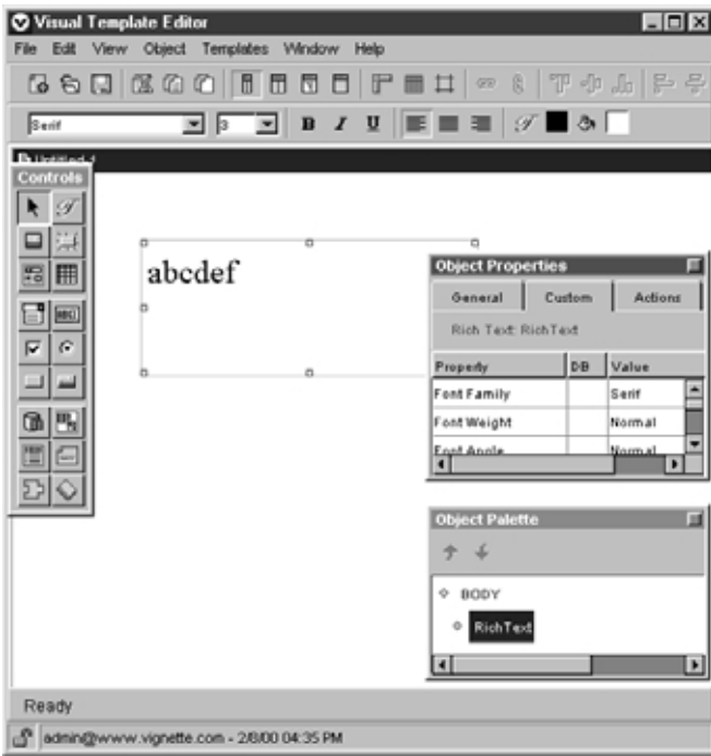
Vignette permite definir plantillas para los tipos documentales que se utilizarán en el sitio web

en la estructura hipertexto del sitio web (los llamados enlaces rotos ).