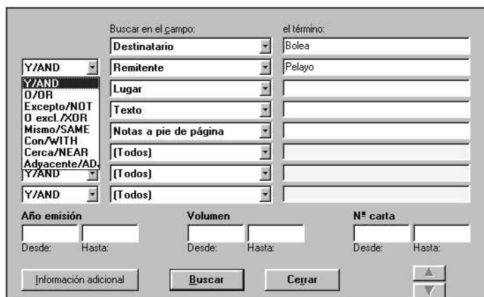
Posibilidades de consulta para el epistolario

En el caso de las obras completas existe la opción "explorar" mediante la cual se abre una ventana a través de la que es posible ver el contenido general clasificado según 15 rúbricas principales en don-