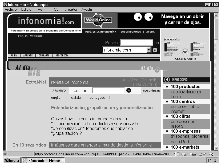
Portada de la nueva empresa virtual